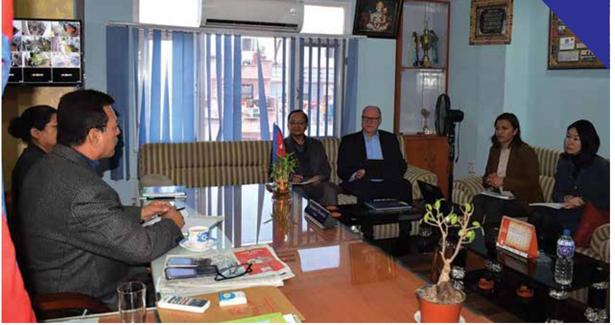
विश्व बैङ्कका प्रतिनिधिसँगको भेटमा महालक्ष्मी नगर प्रमुख र उपप्रमुख