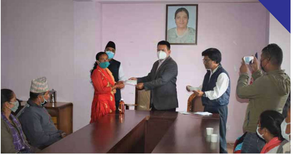
गोठ सुधार कार्यक्रम अन्तर्गतका किसानहरुलाई सहयोग रकम उपलब्ध गराउनुहुँदै नगर प्रमुखज्यू