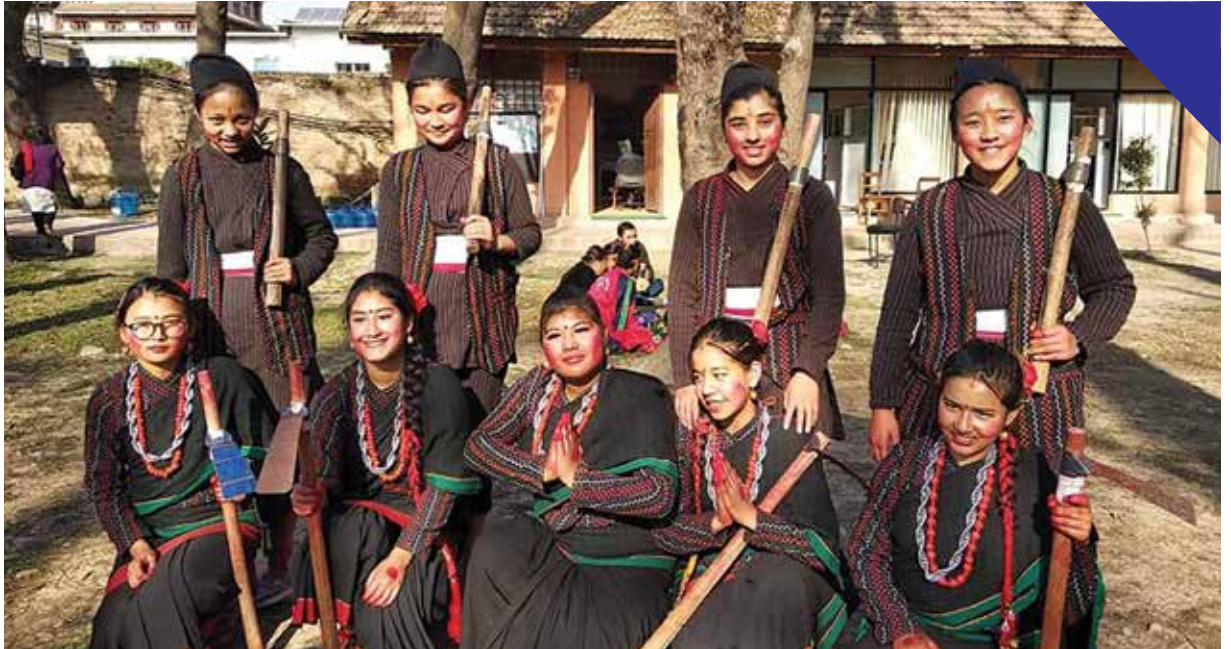
ललितपुर जिल्लाव्यापी लोक नृत्य प्रतियोगितामा यस नगरपालिकाबाट द्वितीय र तृतीय स्थान हासिल गर्न सफल विद्यार्थीहरू