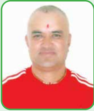
कुवेर केसी वडा अध्यक्ष