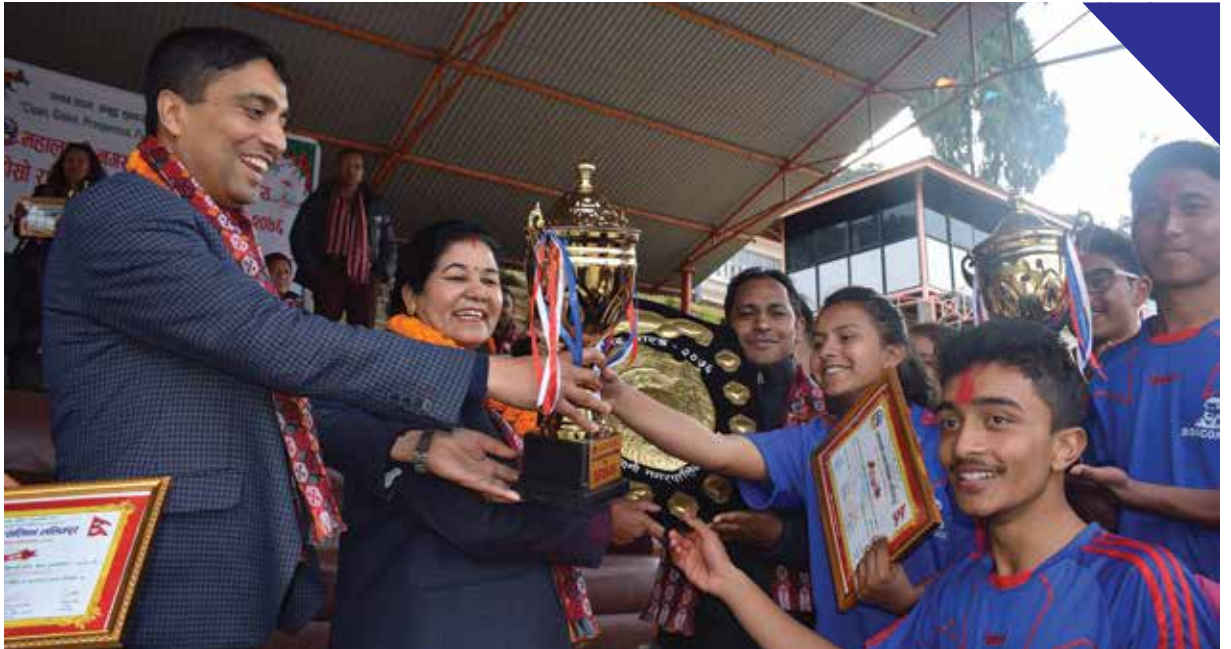
महालक्ष्मी नगरस्तरीय राष्ट्रपति रनिङ सिल्ड प्रतियोगितामा विजयीलाई पुरस्कृत गरिँदै ।