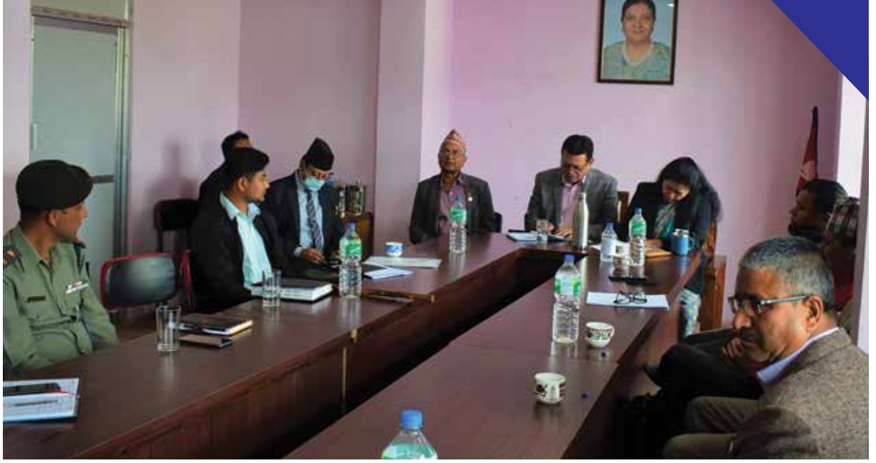
नगरस्तरीय विपद् व्यवस्थापन समितिको बैठक