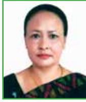
सरस्वती लामा वडा सदस्य - १ कार्यपालिका सदस्य