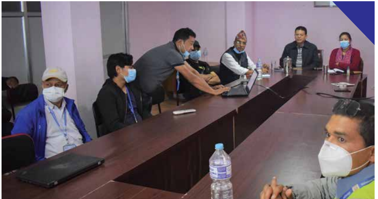
Contact Tracing Team बाट प्राप्त Data सहितको GIS Map को समिक्षा कार्यक्रम