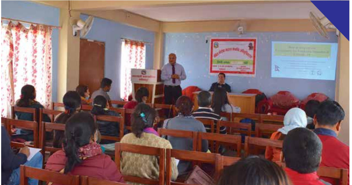
महालक्ष्मी नगरपालिकाका स्वास्थ्यकर्मीहरूलाई कोरोना भाइरससम्बन्धी Advanced तालिम