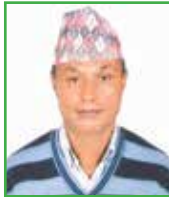
राजकुमार के.सी. वडा सदस्य - ९