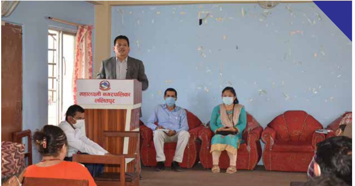
वैकल्पिक प्रणालीबाट शिक्षण सिकाइ प्रारम्भ गर्न सामुदायिक तथा निजी विद्यालयलाई निर्देशन दिनुहुँदै नगरप्रमुखज्यू