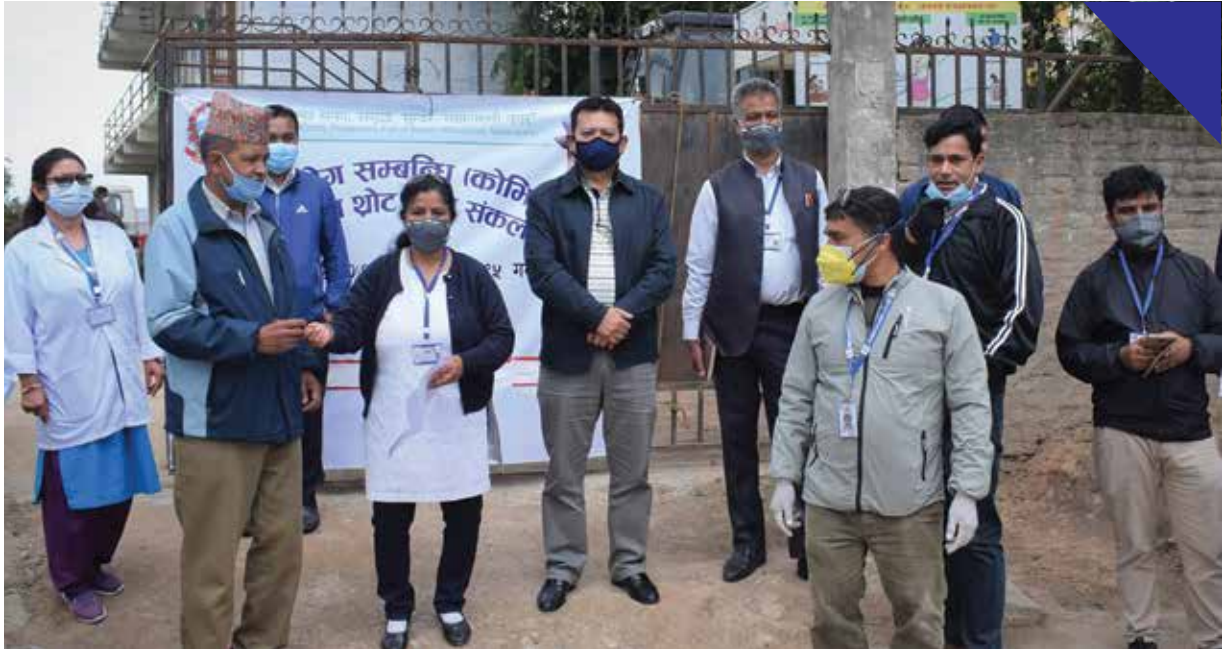
नगर प्रमुखज्यूद्वारा श्रीट स्वाब संकलन केन्द्रको निरीक्षण गर्नुहुँदै