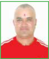
कुवेर के.सी. वडा अध्यक्ष - ३